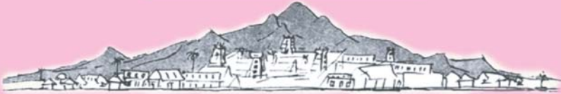
ARUNACHALA HILL (అరుణాచల గిరి)

స్వరణమా శ్రముననె పరముక్తి ఫలద । కరుణామ్య తజలభ యరుణాచ లమిది ॥