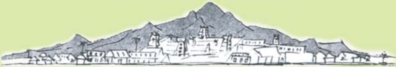
ARUNACHALA HILL (అరుణాచల గిరి)

స్థరణవా శ్రముననె పరముక్తి ఫలద । కరుణాప్య తజలభ యరుణాచ లమిది ॥