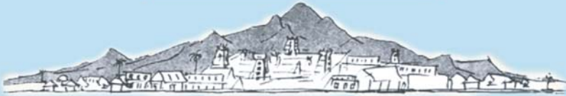
ARUNACHALA HILL (అరుణాచల గిరి)

స్వరణవో శ్రముననె పరముక్తి ఫలద । కరుణావ్యు తజలభి యరుణాచ లమిది ॥