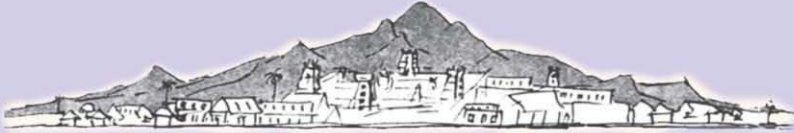
ARUNACHALA HILL (అరుణాచల గిరి)

స్వరాణవనా శ్రీమునై పరముక్తి ఫలద । కరుణావ్య తజలభి యరుణాచ లమిది ॥