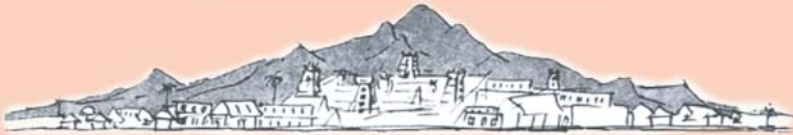
ARUNACHALA HILL (అరుణాచల గిరి)

స్వరణమా త్రముననె పరముక్తి ఫలద । కరుణామ్య తజలభి యరుణాచ లమిది ॥