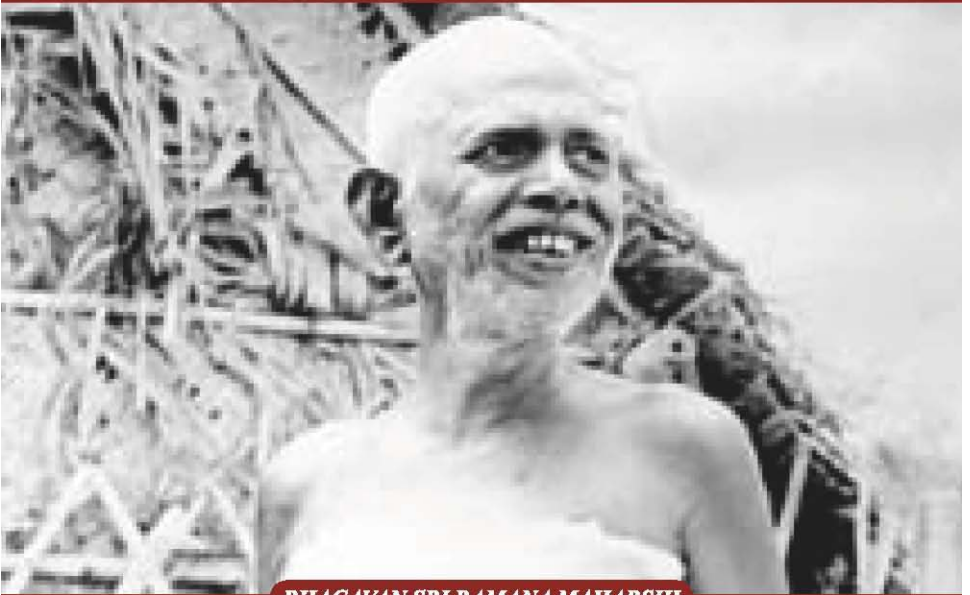
BHAGAVAN SRI RAMANA MAHARSHI

Vol - 44 Issue - 9 Hyderabad September, 2024 Pages - 52 Rs. 10/- Annual Subscription Rs. 100/-