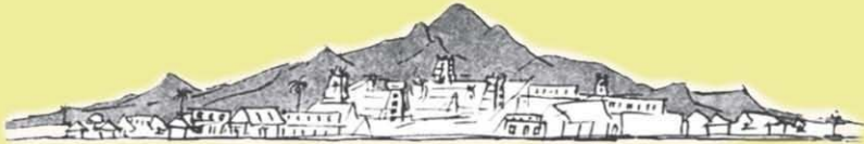
ARUNACHALA HILL (అరుణాచల గిరి)

స్వరణవనా త్రముననె పరముక్తి ఫలద । కరుణావ్యు తజలభి యరుణాచ లమిది ॥